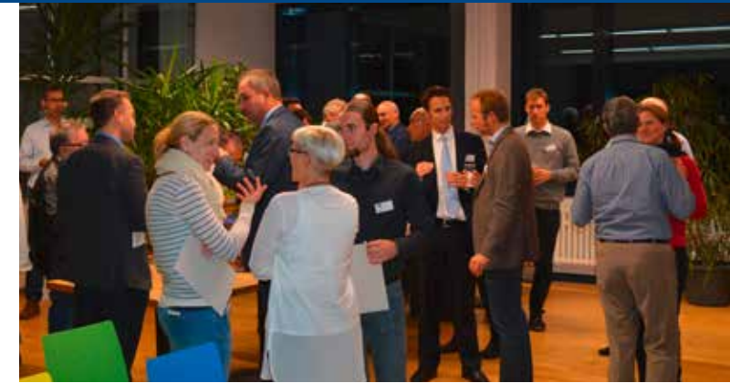
Treffpunkt Innovation 2016 bei Autoimmun Diagnostika GmbH in Straßberg